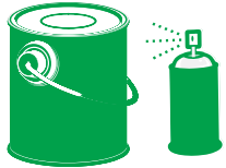
PEINTURES, AÉROSOLS ET CONTENANTS