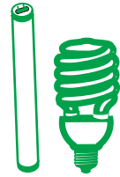
LAMPES AU MERCURE